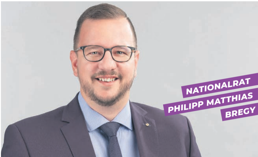
NATIONALRAT PHILIPP MATTHIAS BREGY